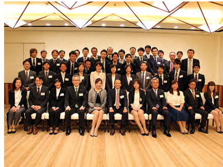
提案夕食会（大阪会場）