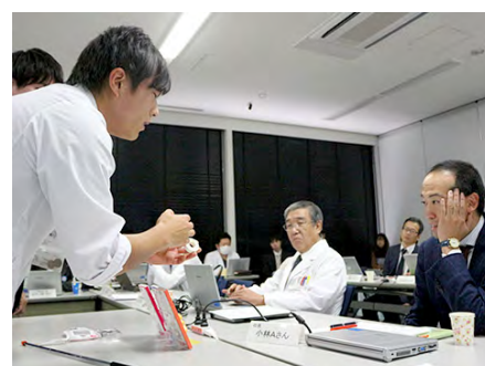
開発参与委員会での説明風景 （右：当社社長）

このようなOJTの機会を活かすためには、年代や階層にかかわらず、意思が尊重される企業風土が必要です。そのため、1995年から「さん付け呼称」を導入し、役職名での呼称を禁止して、従業員全員が一律「さん付け」で呼び合うことにしています。