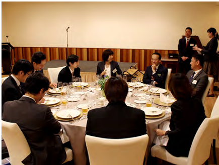
提案夕食会での食事風景

提案制度では、提案件数や提案内容に応じてポイントが与えられます。年に一度、ポイント獲得上位者を集めて社長や会長を囲んでの夕食会が催され、高い問題意識を持った日ごろの取り組み姿勢に対してねぎらいの言葉が贈られます。