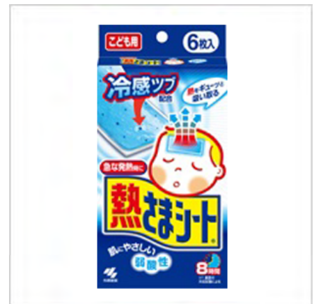
提案制度からできた製品 熱さまシート

全従業員が開発に対する強い意識を持ち、生活者としての視点から暮らし変化の「兆し」を捉える。それが“あったらいいな”をカタチにすることにつながっています。