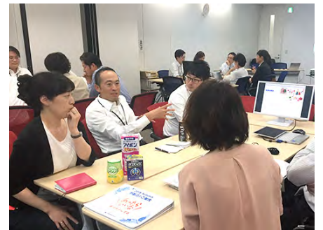
全社員アイデア大会の様子 (左中：当社社長)

2014年から全社員で新製品のアイデアを考える「全社員アイデア大会」という会議を行っています。これは、小林製薬グループの全社員が当社の創立日である8月22日に各人で新製品のアイデアを出し合い、投票等で優れたアイデアを選抜していくものです。勝ち上がった事業部ごとの代表アイデアを役員にプレゼンし、入賞したアイデアは実際に発売する事を目指しています。この活動は小林製薬グループならではの活動として、毎年開催しています。