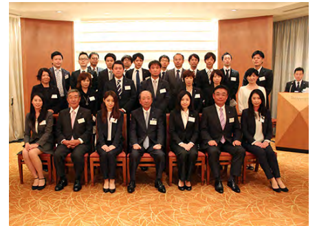
提案夕食会（東京会場）