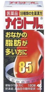
「ナイトール85」（2006年当時）

2006年3月、“中高年男性をターゲットとした健康のための肥満症対策薬”として漢方内服薬『ナイトール85』を発売しました。時代背景も相まって、生活者に広く受け入れられ弊社を代表する大ヒット製品となりました。『ナイトール85』の初年度の売上額は 35 億円に達し、弊社の医薬品新製品において過去最高の年間売上を記録しました。その後も、製品の改良やアイテムの拡充を重ね、 累計出荷 2000 万個のロングセラーブランドに成長 しました。